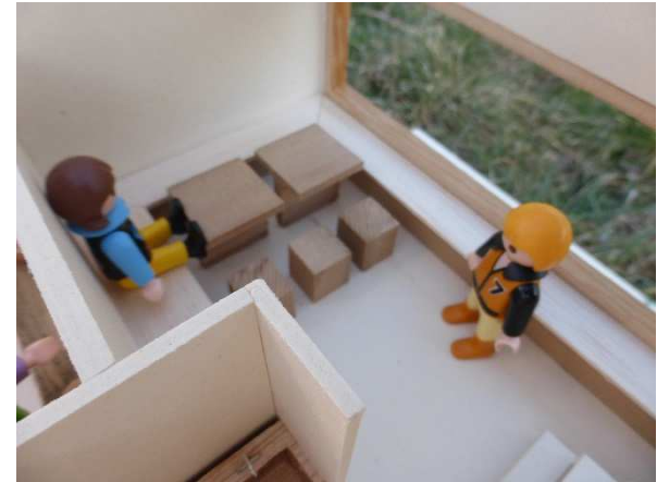
Sitzgelegenheit im Erdgeschoss