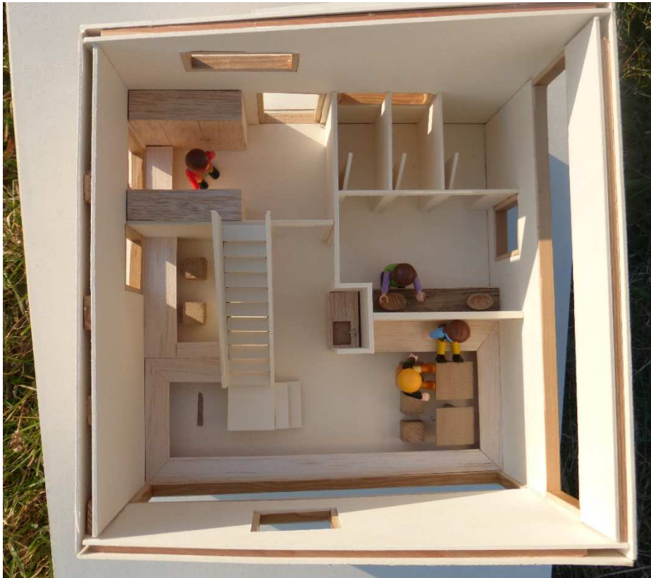
Ansicht Ferienhaus oben Erdgeschoss – Wohnraum