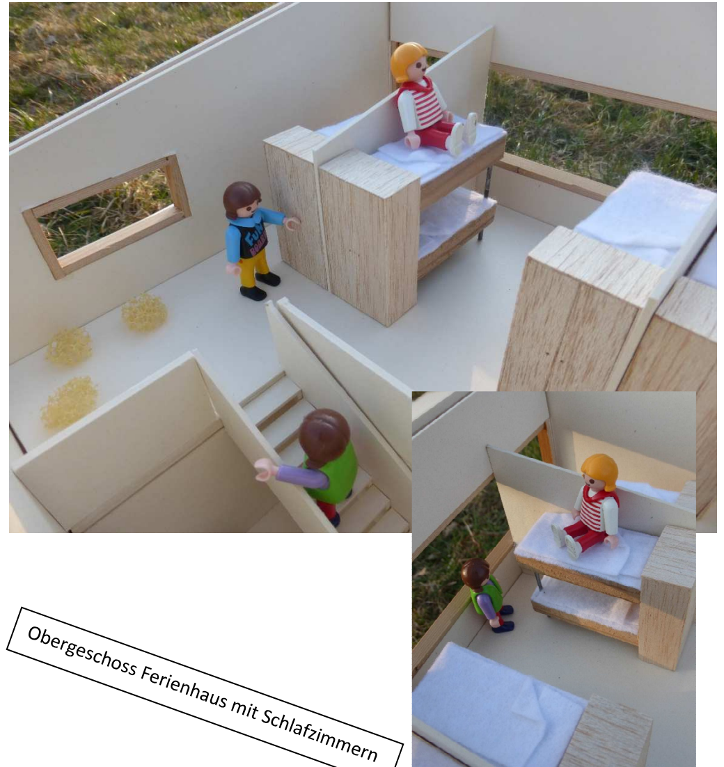
Obergeschoss Ferienhaus mit Schlafzimmern