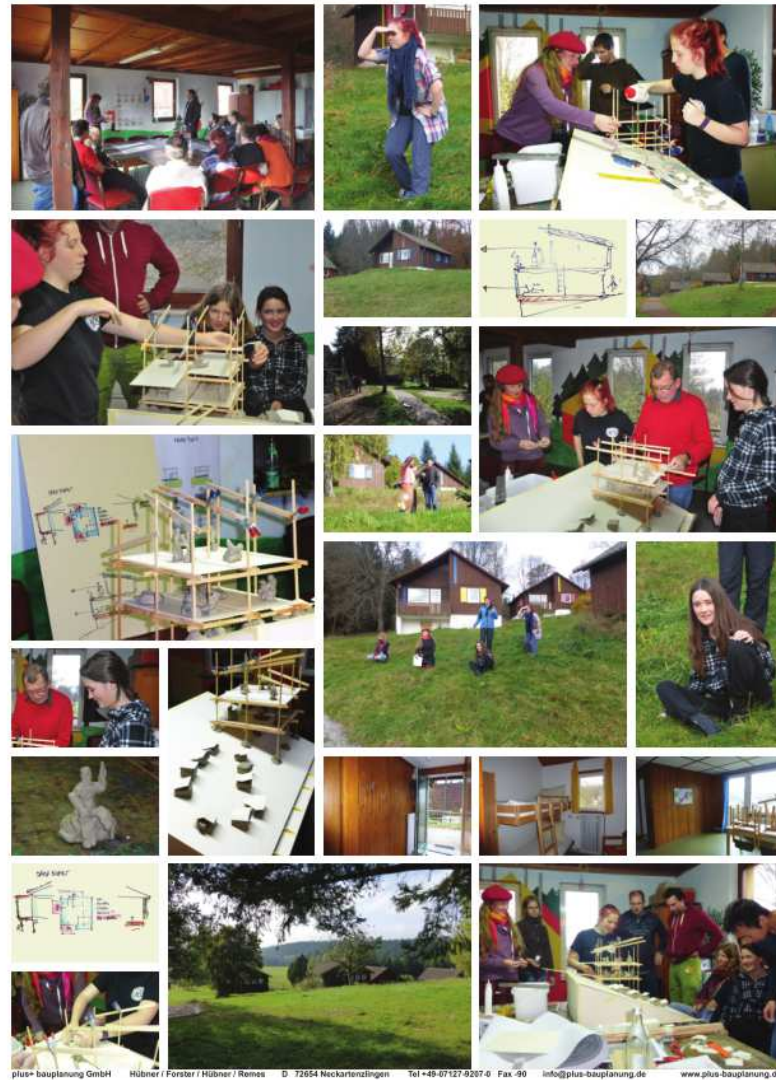
Workshop 2 Gruppe Hütten - Analyse und Experimente 15. November 2014

plus+ bauplanung GmbH Hübner / Forster / Hübner / Remes D 72654 Neckartenzlingen Tel +49-07127-9267-0 Fax -90 info@plus-bauplanung.de www.plus-bauplanung.de